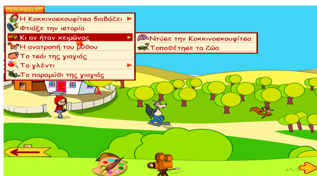
Δραστηριότητα 3: Γλώσσα Α΄ & Β΄ Δημοτικού του Π.Ι.

Στη δραστηριότητα 4 ζητάμε από τα παιδιά να αναγνωρίσουν από τη φωνή που ακούνε το αντίστοιχο ζώο από ένα αρχείο powerpoint. Τα παιδιά της α΄ δημοτικού γράφουν το όνομα του συγκεκριμένου ζώου στο αντίστοιχο πλαίσιο, αντίθετα τα παιδιά του νηπιαγωγείου αναφέρουν το όνομα του ζώου.