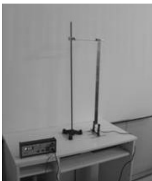
Εικόνα 1. Η διάταξη.

Ορθοστάτης, σύνδεσμοι, μεταλλική ράβδος, φωτοπύλη συνδεδεμένη σε ηλεκτρονικό χρονόμετρο, διαστημόμετρο, μετροταινία, ηλεκτρονικός ζυγός ακριβείας.