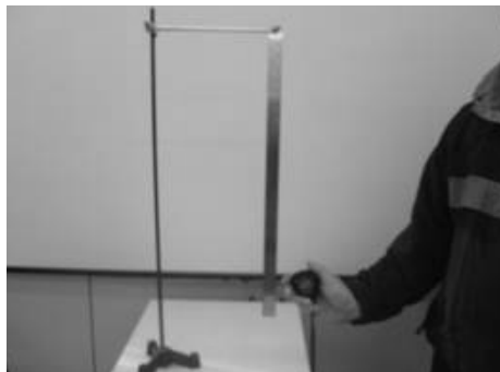
Εικόνα 2. Η ράβδος ως φυσικό εκκρεμές.

Μετρώντας το χρόνο 20 περιόδων βρίσκουμε την περίοδο της κίνησης και επαναλαμβάνοντας το πείραμα 20 φορές υπολογίζουμε τη μέση τιμή της περιόδου. Από την παραπάνω σχέση που δίνει την περίοδο του φυσικού εκκρεμούς υπολογίζουμε τη ροπή αδράνειας της ράβδου.