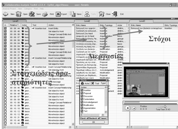
Εικόνα 1. Πολυεπίπεδη αναπαράσταση της δραστηριότητας μέσω CoIAT.

Μία σημαντική δυνατότητα που παρέχει το CoIAT σχετίζεται με τη δυνατότητα δημιουργίας μιας ιεραρχικής δομής περιγραφής της ανθρώπινης (ατομικής ή συλλογικής) δραστηριότητας που ανταποκρίνεται στην προσέγγιση της Θεωρίας Δραστηριότητας (Leontie'v, 1978). Αυτό σημαίνει ότι ο παρατηρητής έχει τη δυνατότητα να μελετήσει μια σειρά από στοιχειώδεις δραστηριότητες, να τις σχολιάσει και να χτίσει ένα υψηλότερο, πιο γενικό και αφηρημένο επίπεδο περιγραφής τους. Το επίπεδο αυτό που είναι το δεύτερο στην ιεραρχία ονομάζεται και Task Level (που αφορά στην ενσυνείδητη δράση του υποκειμένου που καθοδηγείται από συγκεκριμένους στόχους). Ένα τρίτο επίπεδο που είναι και το υψηλότερο ιεραρχικά ονομάζεται Goals Level και περιγράφει τους γενικότερους στόχους που έχει θέσει το υποκείμενο ή τα υποκείμενα.