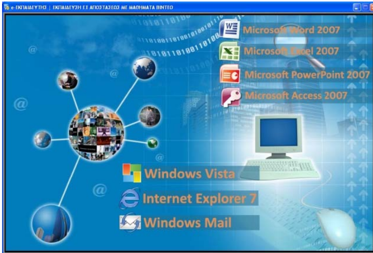
Εικόνα 1: Αρχική οθόνη επιλογής ενότητας

Στην εικόνα 1 παρουσιάζεται η αρχική οθόνη της εφαρμογής που αφορά την επιλογή της ενότητας εκπαιδευτικών μαθημάτων βίντεο.