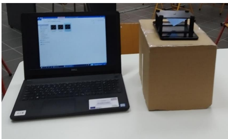
Εικόνα 3. Η διάταξη προβολής των ολογραμμάτων με πυραμίδες

Για την προβολή των ψευδο-ολογραφικών βίντεο, χρησιμοποιήθηκε η διάταξη που απεικονίζεται στην Εικόνα 3. Αποτελούνταν από έναν φορητό υπολογιστή, ένα tablet και την πυραμίδα προβολής ολογραμμάτων (με διαστάσεις 8 εκ. πλευρά βάσης και 4 εκ. ύψος). Στον φορητό υπολογιστή και στο tablet εγκαταστάθηκε το λογισμικό απομακρυσμένης διαχείρισης TeamViewer. Κατά αυτόν τον τρόπο, οι μαθητές επέλεγαν από τον φορητό υπολογιστή το βίντεο που επιθυμούσαν να δουν, το οποίο προβαλλόταν στο tablet και, στη συνέχεια, στην πυραμίδα. Το tablet και η πυραμίδα τοποθετήθηκαν επάνω σε ένα χαρτόκουτο, ώστε να διευκολύνεται η θέαση του ολογράμματος, καθώς αυτό εμφανιζόταν περίπου στο ύψος των ματιών των παιδιών όταν αυτά κάθονται. Αντίστοιχα, στην ομάδα ελέγχου, για την προβολή των συμβατικών βίντεο, χρησιμοποιήθηκαν φορητοί υπολογιστές με μέγεθος οθόνης 15".