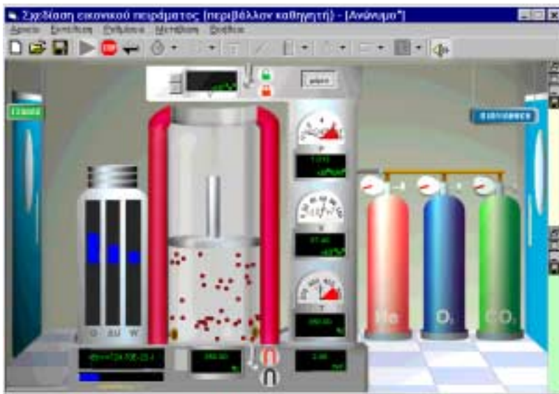
Εικόνα 2: Το εικονικό εργαστήριο Θερμοδυναμικής

Στο εργαστήριο Θερμοδυναμικής υπάρχει μια προκαθορισμένη ρεαλιστική πειραματική διάταξη που επιτρέπει τα πειράματα για την ανάδειξη των νόμων των αερίων, των κυκλικών μεταβολών και των θερμικών μηχανών. Ο μαθητής (ανάλογα με την ελευθερία που του έχει δοθεί από τον εκπαιδευτικό κατά τη σχεδίαση του εικονικού πειράματος) μπορεί να χρησιμοποιεί είτε ιδανικά είτε πραγματικά αέρια. Έμφαση στο εργαστήριο Θερμοδυναμικής δίνεται στην ολοκληρωμένη χρήση και τη συσχέτιση των γραφικών παραστάσεων. Το εργαστήριο παρέχει σε μεγάλο βαθμό ελευθερία χειρισμών και χρησιμοποιεί αντίστοιχη οπτικοποίηση με το εργαστήριο Θερμότητας (Εικόνα 2).