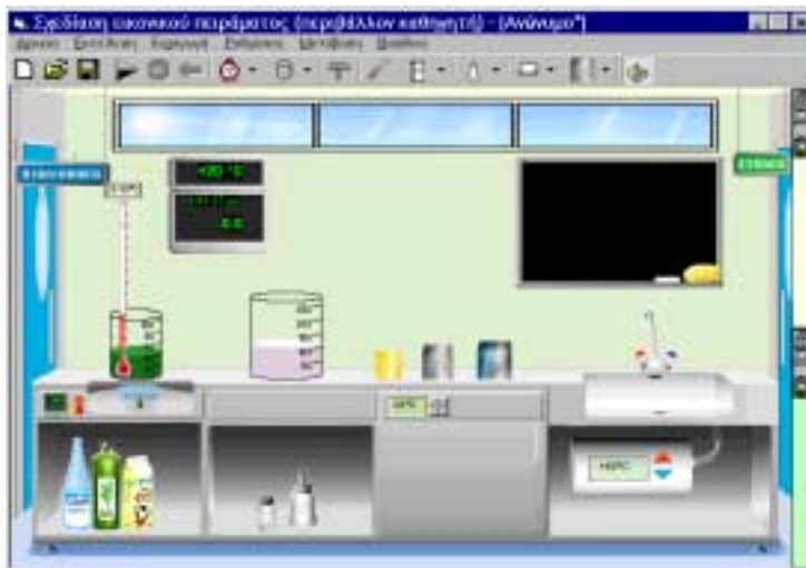
Εικόνα 1: Το εικονικό εργαστήριο Θερμότητας

Ανάλογα με τη μορφή του εικονικού εργαστηρίου (που έχει προ-επιλέξει ο εκπαιδευτικός), ο χρήστης - μαθητής έχει στη διάθεσή του είτε μια προ-κατασκευασμένη πειραματική διάταξη (κλειστό ή παραμετρικό πείραμα), είτε μια ελεύθερη διάταξη που μπορεί ο ίδιος να συνθέσει