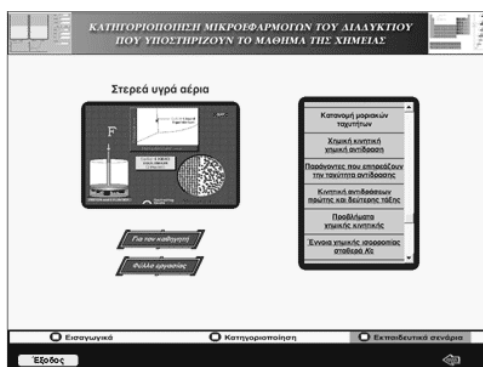
Σχήμα 4: Η επιφάνεια διεπαφής που δίνει τη δυνατότητα στο χρήστη να έχει πρόσβαση στα εκπαιδευτικά σενάρια.