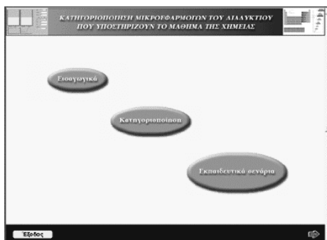
Σχήμα 3: Η επιφάνεια διεπαφής που δίνει τη δυνατότητα στο χρήστη να έχει πρόσβαση στα τρία βασικά κεφάλαια της μικροεφαρμογής.