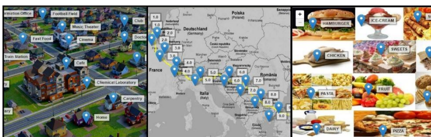
Εικόνα 4: Διαφορετικά παιχνίδια σχεδιασμένα στο ChoiCo

Το γεγονός ότι δεν υπάρχει περιορισμός στη θεματική του ψηφιακού παιχνιδιού που θα σχεδιαστεί, καθιστά το ChoiCo ένα εργαλείο κατάλληλο για τη διερεύνηση ποικίλων γνωστικών αντικειμένων. Μέχρι σήμερα έχει αξιοποιηθεί για τον σχεδιασμό εκπαιδευτικών δραστηριοτήτων που πραγματεύονται διαφορετικά μεταξύ τους θέματα (Εικόνα 4), όπως για παράδειγμα για την περιβαλλοντική εκπαίδευση και την αειφορία, για την πληροφορική, για την ισορροπημένη διατροφή αλλά και για τα αρχαία ελληνικά. Επιπλέον, χάρη στην ευκολία χρήσης των εργαλείων σχεδιασμού του παιχνιδιού, προσφέρει τη δυνατότητα να αναπτυχθούν δραστηριότητες για ένα μεγάλο ηλικιακό φάσμα μαθητών.