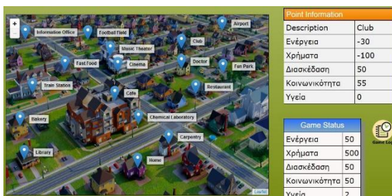
Εικόνα 1: Στιγμιότυπο από ένα παιχνίδι στο περιβάλλον του ChoiCo

Στη λειτουργία παιχνιδιού ο χρήστης μπορεί να παίξει κάποιο παιχνίδι που έχει δημιουργηθεί με το ChoiCo, είτε επιλέγοντας ένα από τα διαθέσιμα παραδείγματα είτε ανοίγοντας ένα παιχνίδι από τον υπολογιστή του. Τα παιχνίδια του ChoiCo, ενώ μπορεί να διαφέρουν θεματικά, έχουν όλα κοινή λογική παιχνιδιού (gameplay). Κάθε παιχνίδι αποτελείται από μια σκηνή η οποία περιλαμβάνει έναν αριθμό από σημεία - επιλογές που σχετίζονται με την αναπαράσταση της. Στο παράδειγμα της Εικόνας 1 η σκηνή αναπαριστά μια πόλη και τα σημεία-επιλογές αφορούν σημεία της πόλης (π.χ. Σπίτι, Νοσοκομείο, Καφετέρια κλπ). Κάθε σημείο έχει ορισμένα χαρακτηριστικά που εμφανίζονται στον πίνακα «Point Information» αριστερά από τη σκηνή κάνοντας κλικ στο σημείο. Επιπλέον υπάρχει ένας δεύτερος πίνακας με τίτλο «Game Status» που αποτυπώνει την κατάσταση του παίκτη ανά πάσα στιγμή σε σχέση με συγκεκριμένους αριθμητικούς δείκτες (π.χ. Υγεία, Χρήματα, Διασκέδαση κλπ).