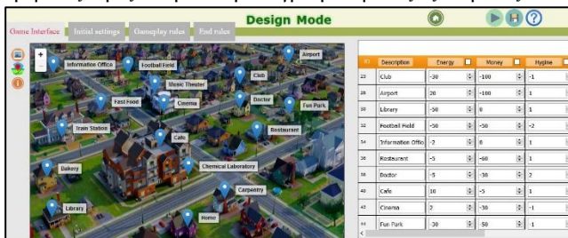
Εικόνα 2: Το περιβάλλον του ChoiCo σε λειτουργία σχεδιασμού παιχνιδιού

Στη δεύτερη καρτέλα ο σχεδιαστής ορίζει τις αρχικές συνθήκες του παιχνιδιού, τις τιμές δηλαδή με τις οποίες θα ξεκινήσει ο παίκτης. Στην τρίτη καρτέλα ορίζονται οι έλεγχοι που θα πραγματοποιούνται σε κάθε ενέργεια του παίκτη και η πιθανή απόκριση του παιχνιδιού, για παράδειγμα η εμφάνιση ενός προειδοποιητικού μηνύματος προς τον παίκτη ή η αναπαραγωγή ενός ήχου. Στη τέταρτη καρτέλα ο σχεδιαστής ορίζει τις συνθήκες τερματισμού του παιχνιδιού (π.χ. Αν τα χρήματα είναι 0 ο παίκτης χάνει). Οι τρεις τελευταίες καρτέλες προσφέρουν στον σχεδιαστή έναν χώρο για προγραμματισμό με blocks. Η λογική της διεπαφής για τον προγραμματισμό είναι παρόμοια με αντίστοιχα περιβάλλοντα όπως το Scratch, στα οποία οι χρήστες συνδυάζουν προγραμματιστικά μπλοκ από διαφορετικές κατηγορίες με σκοπό να φτιάξουν ένα πρόγραμμα (Resnick et. al, 2009). Η διαφορά των block του ChoiCo έγκειται στο γεγονός ότι είναι ειδικά διαμορφωμένα για τον προγραμματισμό των κανόνων ενός ψηφιακού παιχνιδιού. Πιο συγκεκριμένα οι κατηγορίες των block είναι χωρισμένες ανάλογα με τη λειτουργία που προσφέρουν στο παιχνίδι (block αρχικοποίησης, ενημέρωσης του χρήστη, ελέγχου συνθηκών, ροής