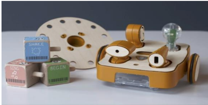
Σχήμα 2. Το ρομπότ KIBO και τα τουβλάκια προγραμματισμού του