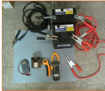
Εικόνα 1. Ο απαραίτητος εξοπλισμός του πειράματος.

Τα αποτελέσματα των μετρήσεων βρέθηκαν ακριβώς ίδια με αυτά που προδιαγράφει η εταιρεία στο SAE paper 951072 του συγκεκριμένου καταλύτη. Στην Τρίτη φάση του σεναρίου με τη βοήθεια του ελεύθερου λογισμικού Tracker analysis video οι συμμετέχοντες υπολόγισαν από το προφίλ RGB τον χρόνο που απαιτείται για την ποράκτωση της αντίστασης του καταλύτη. Επίσης υπολόγισαν με το μοντέλο προσομοίωσης τον όγκο του φορέα από την ακτίνα και το ύψος αυτού. Έγινε υπολογισμός του αριθμού των αυλών ροής καυσαερίων στο μοντέλο και στην φάση αυτοαξιολόγησης ο υπολογισμός έγινε με μαθηματικές πράξεις για επιβεβαίωση των αποτελεσμάτων του μοντέλου. Το ψηφιακό σενάριο έχει αναρτηθεί στη διεύθυνση: