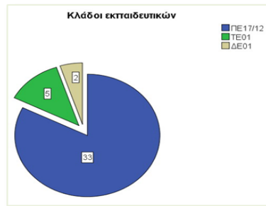
Διάγραμμα 1. Προϋπηρεσία εκπαιδευτικών δείγματος

Στο διάγραμμα 1 παρατηρούμε τους κλάδους των εκπαιδευτικών που συμμετείχαν στην πιλοτική εφαρμογή του σεναρίου και στην έρευνα. Το μεγαλύτερο μέρος (33) είναι πανεπιστημιακής εκπαίδευσης (ΠΕ), 5 ήταν Δευτεροβάθμιας Τεχνικής Εκπαίδευσης και οι 2 Κατώτερων Τεχνικών Σχολών.