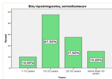
Διάγραμμα 2. Σύσταση του δείγματος

Το μεγαλύτερο ποσοστό (47,5%) του δείγματος είναι εκπαιδευτικοί με προϋπηρεσία από 10 έως 20 έτη (διάγραμμα 2). Ένας πολύ μικρός αριθμός δεν εκδηλώνουν ενδιαφέρον στη χρήση υπολογιστών ενώ οι υπόλοιποι 38 από τους 40 του δείγματος δήλωσαν ότι ενδιαφέρονται. Αξιοσημείωτο είναι ότι μόνο 4 από το σύνολο έχουν παρακολουθήσει κάποιο πρόγραμμα καινοτομιών, το 90 % δεν είχε την τύχη να επιμορφωθεί στις καινοτομίες στην εκπαίδευση. Το 100% του δείγματος δεν έχει αναπτύξει ψηφιακό διδακτικό σενάριο. Δύο εκπαιδευτικοί δήλωσαν ότι έχουν κάνει κάποια εφαρμογή σεναρίου.