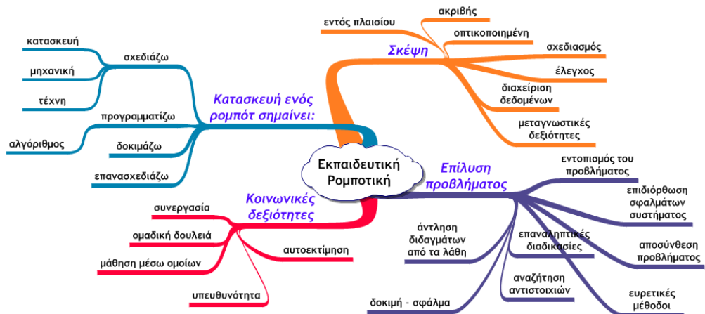
Σχήμα 1: Οι δραστηριότητες μέσα στο πεδίο της εκπαιδευτικής ρομποτικής μπορούν να αναπτύξουν πολλές ικανότητες. (Kabátová & Pekárová, 2010)

Οι μαθητές που ασχολούνται με την εκπαιδευτική ρομποτική αποκομίζουν πολλαπλά οφέλη. Όπως παρουσιάζεται στο διάγραμμα του σχήματος 1, η εκπαιδευτική ρομποτική υποστηρίζει την ανάπτυξη κοινωνικών δεξιοτήτων μέσω συνεργασίας στην ομάδα, εκμάθησης από τους συνομηλίκους, ενώ ωθεί τους μαθητές στην υπευθυνότητα και τονώνει την αυτοπεποίθησή τους.