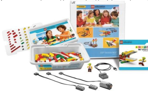
Σχήμα 2: Lego Education WEDO

Το κουτί περιέχει περισσότερα από 150 τουβλάκια, συμπεριλαμβανομένου ενός κινητήρα, ενός αισθητήρα κλίσης, ενός αισθητήρα κίνησης και ενός USB hub για σύνδεση με τον υπολογιστή. Συνοδεύεται από δικό του οπτικό περιβάλλον προγραμματισμού που στηρίζεται σε εικονίδια και παρέχει ένα διαισθητικό προγραμματιστικό περιβάλλον με οδηγίες κατασκευής ρομπότ και παραδείγματα προγραμματισμού. (Mayerονά, 2012)