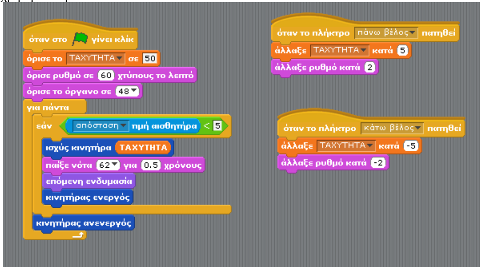
Σχήμα 6. Λύση του σεναρίου 5

αισθητήρας της απόστασης και εισάγεται και η εντολή εάν (Σχήμα 6). Οι νέες εντολές υποδεικνύονται στους μαθητές και εκείνοι καλούνται να σκεφτούν πώς θα τις χρησιμοποιήσουν.