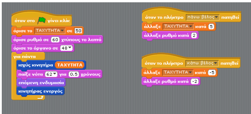
Σχήμα 5. Λύση του σεναρίου 4

Την τέταρτη διδακτική ώρα οι μαθητές εργάστηκαν πάλι σε δύο σεναρία - δραστηριότητες. Στο σενάριο 3 οι μαθητές κλήθηκαν να αντικαταστήσουν την εντολή επανάλαβε με το για πάντα έτσι ώστε ο πίθηκος να παίζει ντραμς συνεχώς. Στο σενάριο 4 οι μαθητές κλήθηκαν να εισάγουν μια μεταβλητή που θα ρυθμίζει την ταχύτητα των χτυπημάτων και η οποία θα αυξάνεται ή θα μειώνεται κάνοντας χρήση του πάνω και κάτω βέλους του πληκτρολογίου αντίστοιχα. Δόθηκαν και σε αυτό το σενάριο οι νέες εντολές που θα έπρεπε να χρησιμοποιηθούν και τα παιδιά πειραματίστηκαν με τη σειρά με την οποία θα πρέπει να τοποθετηθούν ώστε να έχουμε το επιθυμητό αποτέλεσμα (Σχήμα 5).