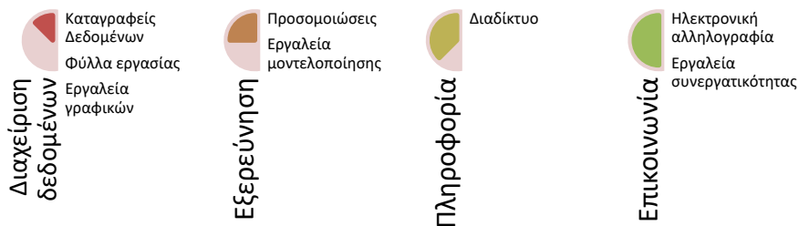
Σχήμα 2. Εργαλεία ΤΠΕ στις θετικές επιστήμες

Οι Osborne & Hennessy (2003) χαρακτηρίζαν την παιδαγωγική μέχρι εκείνα τα χρόνια αρκετά συντηρητική καθώς στη βασική της δομή περιέχονται οι διαλέξεις των εκπαιδευτικών, ενώ διαπιστώνεται πως η ταχύτητα εξέλιξης των ΤΠΕ είναι τρομακτικά γρήγορη. Οι θετικές επιστήμες και η έρευνα στη διδασκαλία και μάθηση αναπτύσσονται με μία προβλεπόμενη κανονικότητα, επιτρέποντας στους Katz & Golden (2008) να μιλήσουν για τον αγώνα δρόμου μεταξύ τεχνολογίας και εκπαίδευσης. Παραδοσιακά, οι ΤΠΕ χρησιμοποιούνται στις θετικές επιστήμες σε τέσσερις βασικές περιοχές δράσης: διαχείριση δεδομένων, πληροφορία, επικοινωνία και εξερεύνηση και κάθε μία από αυτές τις θεματικές περιοχές καλύπτει ένα εύρος λογισμικών και μηχανικών μερών (Σχήμα 2).