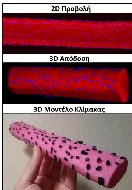
Σχήμα 4. 2d προβολή, 3d απόδοση, 3d βιοπλαστικό μοντέλο ανθρώπινης μυϊκής ίνας (μεγέθυνση 500 φορές). Μπλε: μυο-पुरीνες, Κόκκινο/Ροζ: κύτταρο

Οι Ferdig et al. (2015) για να αξιολογήσουν την αποτελεσματικότητα της χρήσης στερεοσκοπικών εικόνων στη διδασκαλία βιολογικών εννοιών, έλεγξαν τη χρήση τεχνολογίας 3d σε δύο μαθήματα, δύο διαφορετικών σχολείων. Η μελέτη και η σύγκριση μεταξύ των διαφορετικών ομάδων της έρευνας, έδειξε πως οι μαθητές που χρησιμοποίησαν 3d εικόνες πέτυχαν επιδόσεις, στατιστικά σημαντικές, σε σχέση με τους συμμαθητές τους που διδάχθηκαν χωρίς τη χρήση 3d εικόνων (Ferdig et al., 2015).