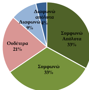
Σχήμα 1: Το wiki παρέχει ευκολία πρόσβασης και χρήσης

Στις απαντήσεις ελεύθερης ανάπτυξης οι 30 από τους 49 συμμετέχοντες ανέφεραν ως χαρακτηριστικό του wiki χρήσιμο στην εκπόνηση της εργασίας τους, την ευκολία διαμόρφωσης περιεχομένων των σελίδων και ενσωμάτωσης web 2.0 αντικείμενων, ενώ 4 συμμετέχοντες ανέφεραν επίσης τη δυνατότητα εισαγωγής συνδέσμων. Στην καταγραφή των στοιχείων που τους δυσκόλεψαν στη χρήση του wiki, το 33% απάντησε ότι δεν τους δυσκόλεψε τίποτα και μόλις ένας ανέφερε ότι συνάντησε δυσκολία κατά την αρχική του σύνδεση στην πλατφόρμα wikispaces. Από 5 συμμετέχοντες αναφέρθηκε πρόβλημα στη χρονική απόκριση του wikispaces, όπως ότι: «υπήρχε μικρή καθυστέρηση στην απόκριση της πλατφόρμας», «Όταν δούλευαν όλα τα μέλη παράλληλα, παρατηρήθηκε να "κολλάει" το wiki ή να μην κάνει τις αλλαγές όπως τις δημιουργούσαμε, οπότε σε κάποιες φάσεις για να αποφύγουμε ορισμένα "κολλήματα" συνεννοηθήκαμε και λειτουργούσαμε σειριακά». Όντως, το τεχνικό πρόβλημα που αναφέρεται συχνότερα σε μελέτες εφαρμογής wikis είναι όταν πολλοί χρήστες επεξεργάζονται ταυτόχρονα μια σελίδα με αποτέλεσμα να υπάρχουν περιστασιακές συγκρούσεις, και το λογισμικό να μην είναι σε θέση να αντιμετωπίσει την ταυτόχρονη δημοσίευση (Wheeler et al, 2009; LI, 2015).